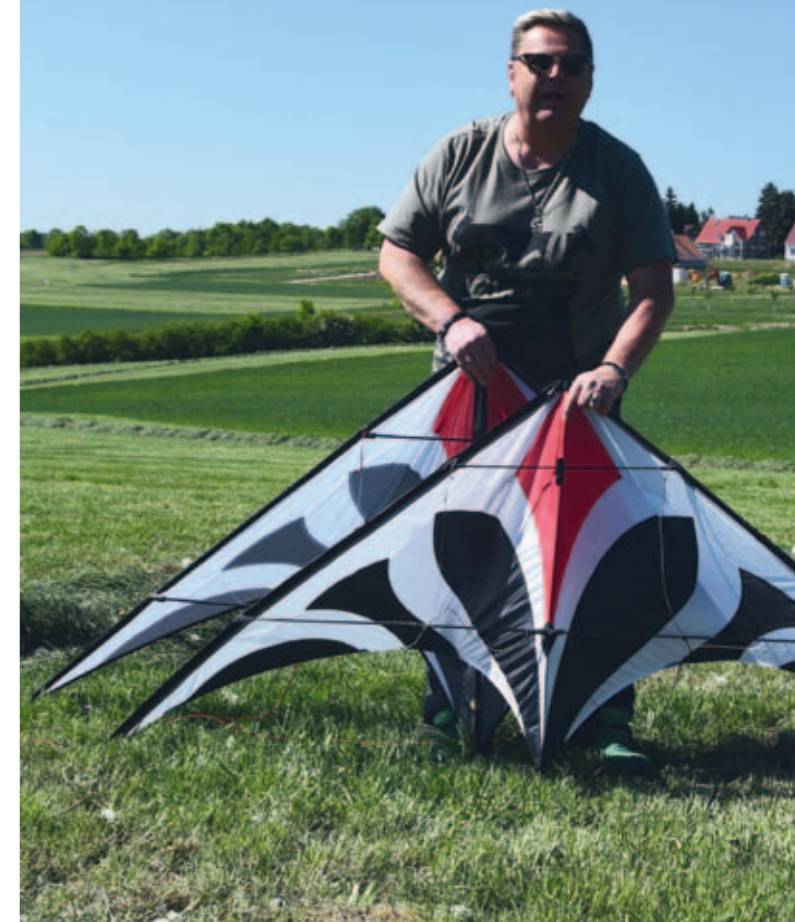
Wunderbar aggressiv geht der Kite durch die Lazy Susan