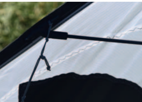
Knotenleiter zur Waagestrimmung